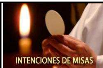
INTENCIONES DE MISAS

No hay oración mas poderosa que la Misa, y no hay mas grande manera de demostrar nuestro amor a nuestros difuntos que ofrecerles Misas. Es una